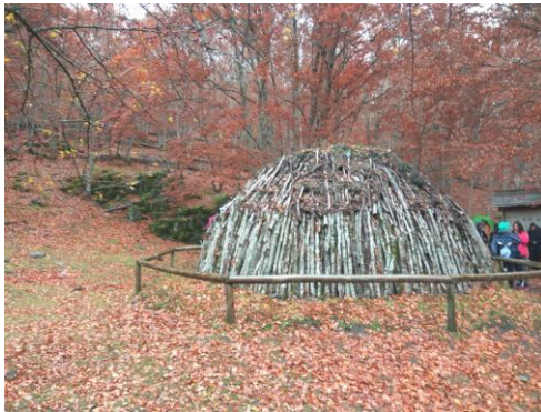
Reconstrucción de una carbonera en el Hayedo, especie de horno para conseguir carbón de la leña