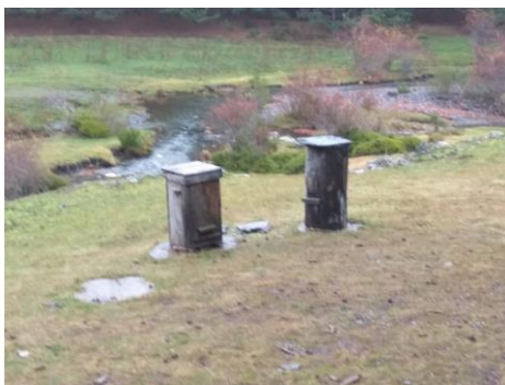
Colmenas en el Hayedo