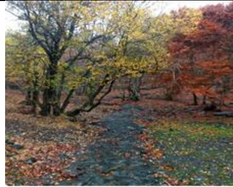
Los contrastes de colores en el otoño del Hayedo