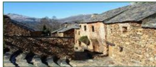
Anfiteatro de Umbralejo y ejemplo de la arquitectura negra