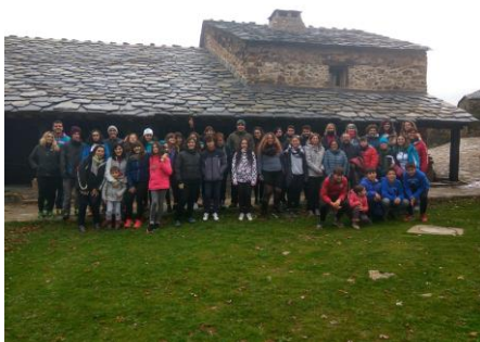
El grupo de participantes en Umbralejo